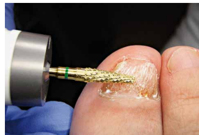
H79GP - kompromisslos für die Bearbeitung von mykotischen Nägeln

Zum effizienten und schnellen Beschleifen von verhornten Hautschichten und Nägeln.